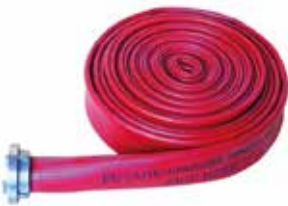
2" Kauçuk Hortum