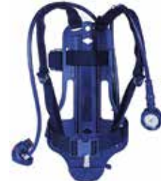
Solunum Seti Yeleği