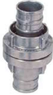
Alüminyum Hortum Rekoru