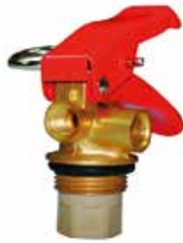
Yangın Tüpü Tetiği 1-2 kg