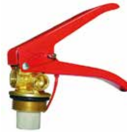
Yangın Tüpü Tetiği 6 kg