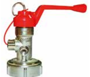
Yangın Tüpü Tetiği 25-50 kg