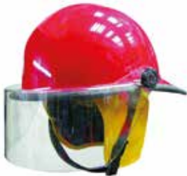
İtfaiyeci Bareti - 1

Uygun CE Sertifikalı Olarak Üretilmektedir.