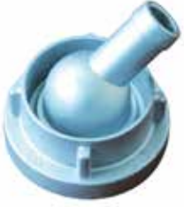
2x1" Alüminyum Düşürücü Rekor