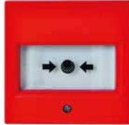
Yangın İhbar Butonu