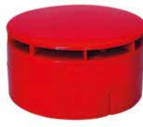
Yangın İhbar Sireni