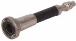
2" Alüminyum Lans