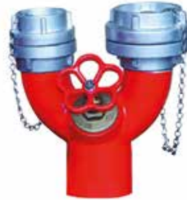
2" İtfaiye Bağlantı Ağızı