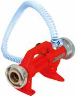
2" Köpük Melanjörü