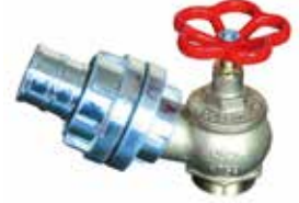
2" Yangın Vanası