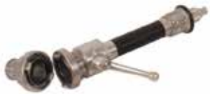
2" Kumandalı Lans