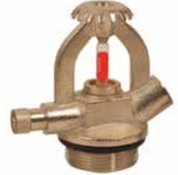
Yangın Tüpü Sprinkleri