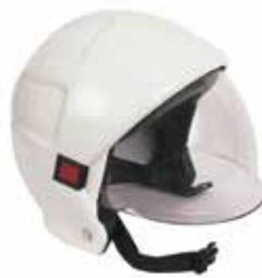
İtfaiyeci Bareti - 2