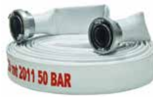
2" Bez Hortum Beyaz