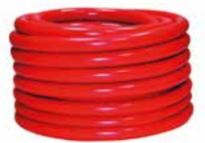
1" Kauçuk Hortum