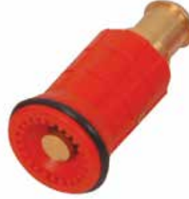
1" Sis Başlığı