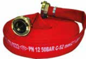
2" Bez Hortum Kırmızı