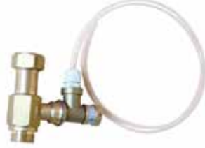
1" Köpük Melanjörü