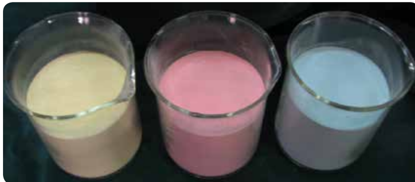
Yangın Söndürme Tozları RUHL - FUREX - MEGAVİT %40 MAP ve %90 MAP