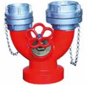
4" İtfaiye Bağlantı Ağızı