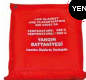
Yangın Battaniyesi 150x200